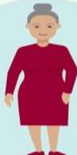
Женщины 55–60 лет