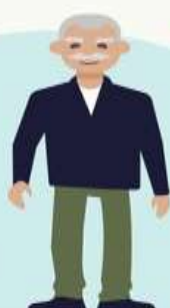
Мужчины 60–65 лет

до выхода на пенсию — это предпенсионный возраст